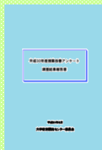
授業改善アンケート結果報告書