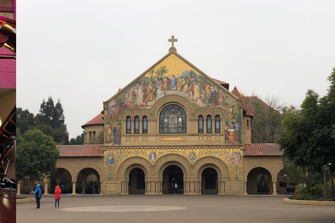
名門スタンフォード大学