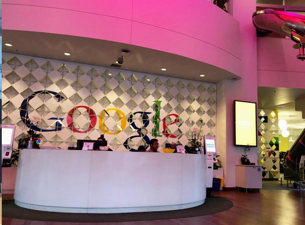
IT起業メッカのシリコンバレー