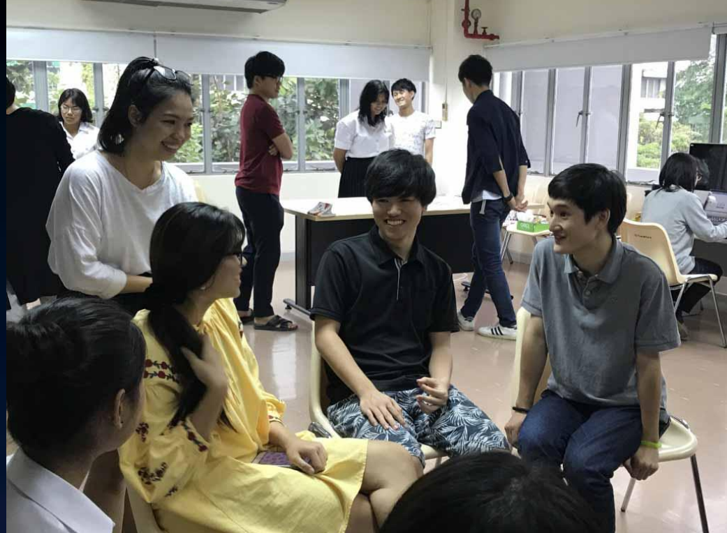
タイの協定校での学生交流