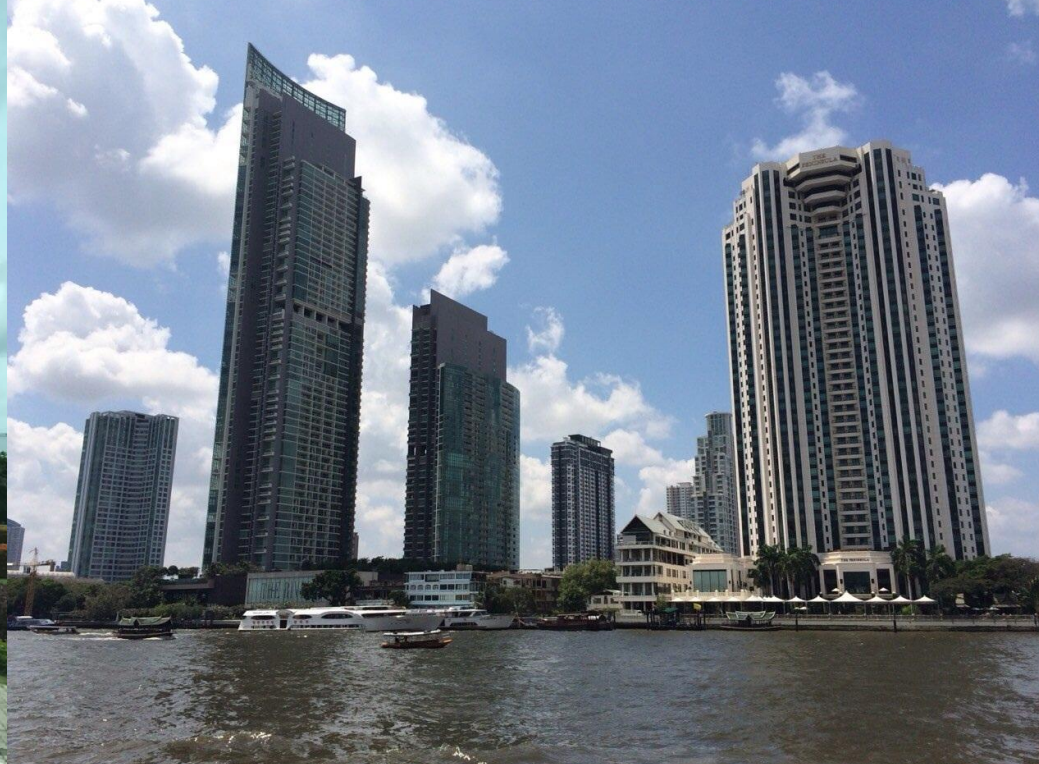
急速な経済成長のバンコク